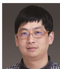
张锋 教授 | 中国 复旦大学附属妇产科医院教授 遗传工程国家重点实验室PI 上海市女性生殖内分泌相关疾病重点实验室副主任