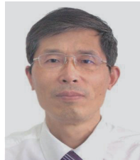
顾学范 教授 | 中国 上海市儿科医学研究所副所长 上海交通大学医学院附属新华医院小儿内分泌 / 遗传科主任 卫生部新生儿疾病筛查专家，卫生部生殖健康专家组成员，卫计委罕见病诊疗与保障专家委员会委员