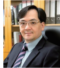
梁德杨 教授 | 中国香港 香港中文大学产前诊断中心主任 美国围产杂志编委 香港中文大学妇产科学系系主任