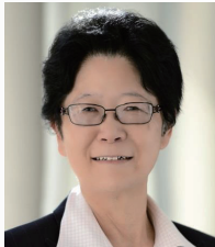
张秀慧 教授 | 美国 美国贝勒医学院分子和人类遗传学教授 医学遗传实验室所属细胞遗传实验室主管