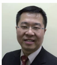
蔡光伟 教授 | 中国香港 香港中文大学产前基因诊断中心副主任 植入前遗传学诊断中心主任 广州医学院及海南医学院客座教授 山东大学客座教授香港中文大学妇产科学系副教授